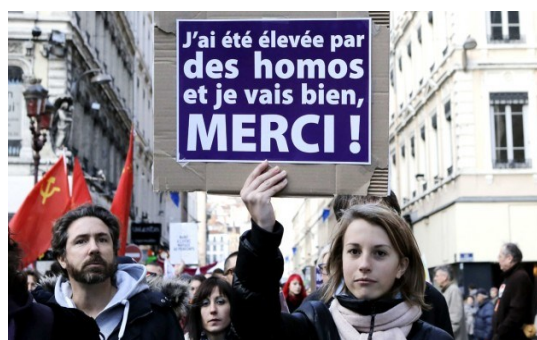
Manifestation pour la mariage pour tous, à Lyon, le 15 décembre 2012.

Un homosexuel est avant tout un être humain, nous sommes dans un pays libre ou tout le monde a le droit et le choix de faire, d'aimer qui il veut ou d'avoir sa propre opinion sur un sujet délicat. De notre point de vue, l'homophobie n'est que le rejet de la différence et prouve un réel manque de tolérance et de fraternité.