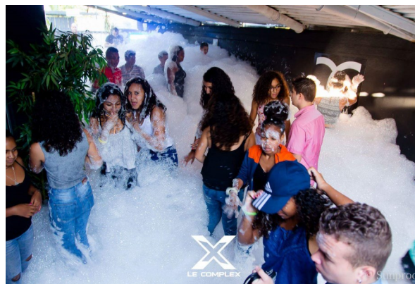
Soirée mousse durant la Teens party 3.

On peut noter qu'en effet, les parents ne sont pas conviés et à 12 ans, on n'est pas forcément conscient de ce que l'on fait. Par conséquent, aucune personne responsable ne peut nous dire réellement ce qui se passe durant ces petites fêtes.