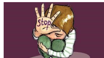
Le carnet des droits de l'Homme