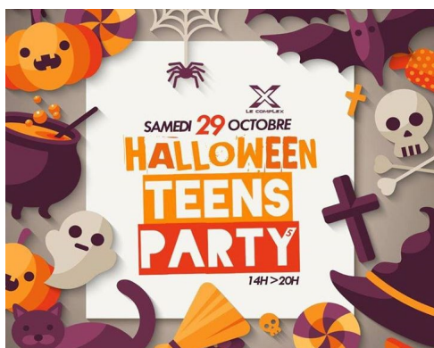
Affiche publicitaire pour la 5ème Teens party.

En ce moment, à La Réunion, une nouvelle tendance touche les adolescents de 12 à 17 ans. Des « Teens party » se déroulent dans une boîte de nuit, le CompleX, à Saint-Pierre. Celles-ci consistent à se réunir entre jeunes afin de se divertir notamment le samedi ou lors de certains événements comme, par exemple, pour Halloween.