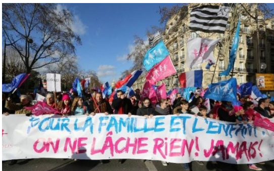
Manifestation du dimanche 16 octobre 2016 à Paris.

Des milliers de personnes ont manifesté dimanche 16 octobre à Paris pour demander l'annulation de la loi sur le mariage homosexuel trois ans après son adoption en France et défendre la famille traditionnelle, à six mois de l'élection présidentielle française.