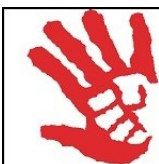
Emblème de la manifestation sur la prévention de la violence